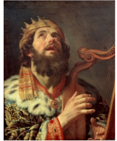
Koning Dawid met sy geliefde lier