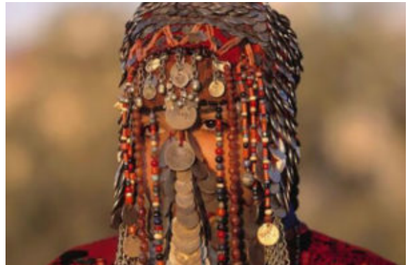
Rebekka dogter van Betuel

LAGAI-ROÏ-FONTEIN. - Daar heers groot opgewondenheid in sosiale kringe hier oor die huwelik aanstaande week tussen Isak, seun van die skatryk Abraham seun van Tera, en die beeldskone Rebekka, dogter van Betuel van Haran in Mesopotamië. Heelwat jong dames sal waarskynlik in die volgende paar dae trane van teleurstelling moet wegpink, aangesien Isak, die enigste erfgenaam van Abraham se groot sakeryk, allerweë beskou is as die hubaarste man in Kanaän.