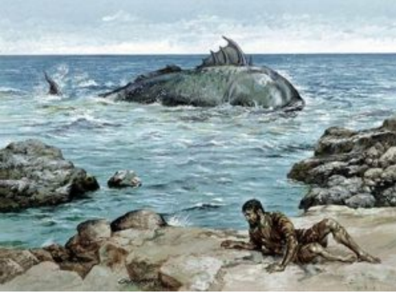
Die profeet Jona, veilig op land

JOPPE. – 'n Man het gister in 'n gehawende toestand hier aangekom nadat hy na bewering drie dae en drie nagte lank in 'n vis se maag was.