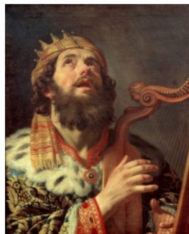
Koning Dawid met sy geliefde lier